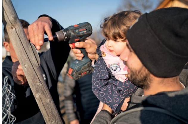
Jeder Baum wird mit einem Namensschild versehen.