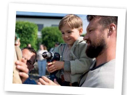
Alle helfen mit!