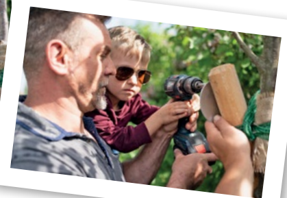
Die Geschwisterkinder durften beim Anbringen der Namensschilder helfen.