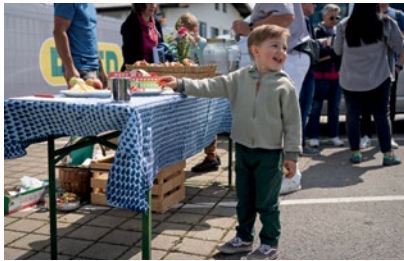
Große Erdbeerliebe – die Jause war eindeutig ein Highlight.