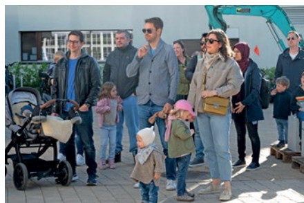
Bei schönem Wetter trafen sich 36 Familien zur Baumpflanzaktion bei der Säge, dem Vereinshaus und Georgsweg.