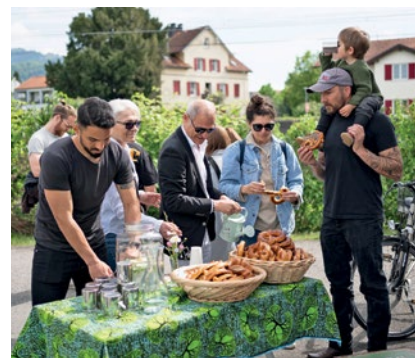
Bei einer leckeren Jause ließen die Familien die schöne Aktion ausklingen.