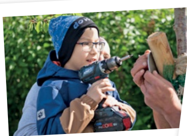
Eine große Hilfe beim Anbringen des Namensschildchens.