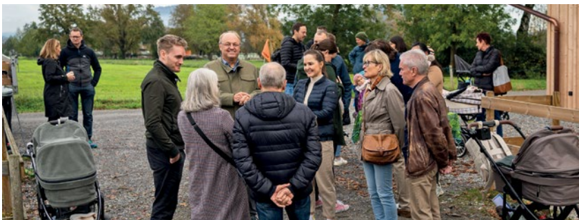
Viele Familien erschienen zur herbstlichen Baumpflanzaktion.