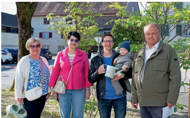
Raphael hat jetzt ein Bäumchen mitten in Lauterach stehen.