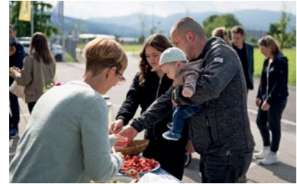
Zur Stärkung wartete eine gesunde Jause auf die Familien.