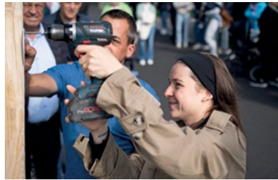
Gemeinsam mit den Familien werden die Namensschilder angebracht.