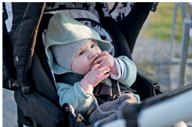
Gute Laune bei der Baumpflanzaktion