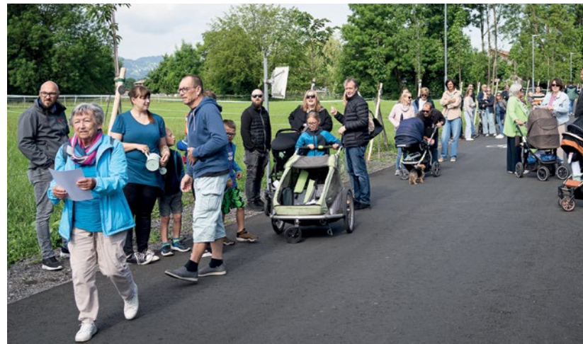
Viele Familien versammelten sich im Unteren Schützenweg, um die Lebensbäume ihrer Kinder mit persönlichen Namensschildern zu versehen.