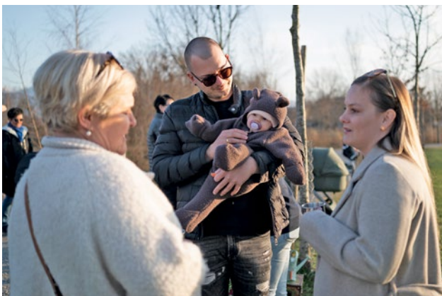
Schöner Austausch am Jannersee