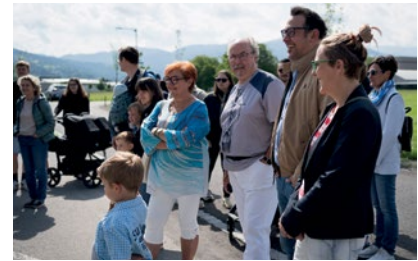
Ein besonderer Moment für alle Generationen.