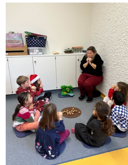
Elementare Musikpädagogik, @ Kindergarten Seifenfabrik

Sich besser spüren lernen, soll das Ziel sein und um es zu erreichen, müssen alle Sinne gut zusammenspielen. In unserem Kindergarten arbeiten wir mit einem besonderem Sensoriktsch, der alle paar Wochen für die Kinder neu befüllt wird. Die von uns ausgewählten Materialien regen die Sinneswahrnehmung der Kinder an und laden ein zum täglichen Fühlen und erforschen auf spielerische Art und Weise.