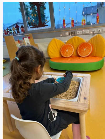
Sensorische Integration, @ Kindergarten Seifenfabrik

Weiterbildung ist eine wichtige Ressource für das Personal unseres Kindergartens. Wir sind bemüht uns nach den neuesten wissenschaftlichen Erkenntnissen weiterzuentwickeln. Verschiedene pädagogische Ausrichtungen, die in unsere tägliche Arbeit einfließen, sind unter anderem: