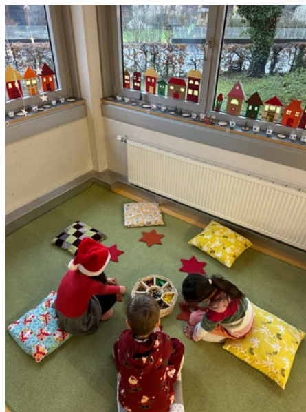
@ Kindergarten Seifenfabrik