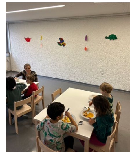
@ Kindergarten Seifenfabrik

erinnern alle Kinder um 10:00 Uhr noch einmal daran die eigene Jause zu essen. So lernen die Kinder auch beim Essen ruhig sitzen bleiben zu können um ihr Essen achtsam in der Gemeinschaft der anderen genießen zu können. Für alle Kinder der Ganztagesgruppe, gibt es bei uns täglich ein warmes Mittagessen das von der SeneCura mit viel Liebe zubereitet wird. Die Kinder dürfen dann gemeinsam und in Ruhe ihr Mittagessen genießen. So erfahren die Kinder, das Essen auch etwas Geselliges ist, das unserer Wertschätzung und Wahrnehmung bedarf.