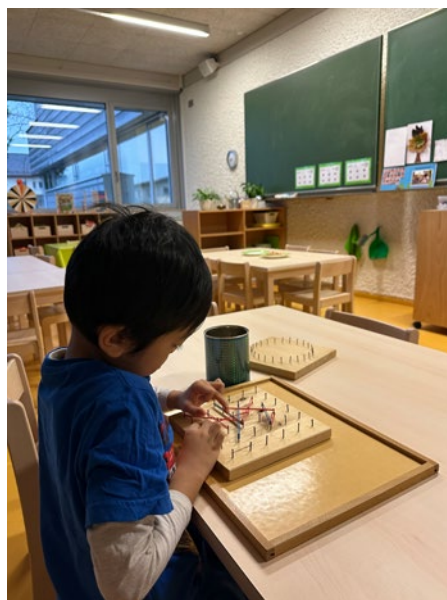
@ Kindergarten Seifenfabrik

Sonstige Dokumente, die vom Bund mit Zustimmung des Land Vorarlberg zur Verfügung gestellt werden.