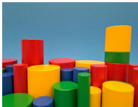
Sinnesmaterial @ Kindergarten Hofsteigsaal

besteht darin, dem Kind die Eindrücke, die von den Sinnesorganen empfangen werden, zu ordnen und damit das Wesen aller Gegenstände unserer Umwelt besser verstehen und merken zu können. Auch ist das Sinnesmaterial dazu geeignet, besonders bei kleinen Kindern zwischen Drei und Vier Jahren, Konzentration zu erzeugen. Deshalb ist dieses Material nicht nur Schlüssel zur Erforschung der Umgebung, sondern auch Mittel zur Entwicklung des mathematischen Geistes. Um das Kind nicht mit der Reizung aller Sinnesorgane zu überfordern, sind diese Sinnesmaterialien so gefertigt, dass nur auf eine Eigenschaft der Dinge besonderes Augenmerk gerichtet wird. Die Materialien