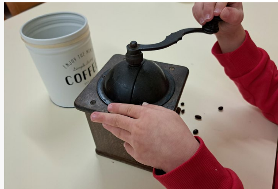
Übung des täglichen Lebens.

beim Pflanzen gießen mit Wasser, wird durch die Drehung des Handgelenkes auf das Schreiben, später in der Schule, vorbereitet. Die Fehlerkontrolle liegt immer im Material und nicht bei der Pädagogin, z. B. beim Löffeln gehen Körner daneben, der Tisch ist schmutzig. Aus diesem Grund wird das Kind seine Bewegung beim Verrichten der Übung selber soweit optimieren, bis kein Fehler mehr erkennbar ist.