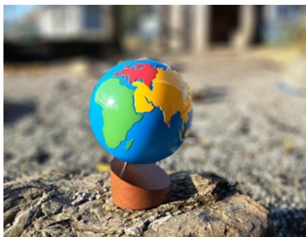
Kosmische Erziehung @ Kindergarten Hofsteigsaal

Im Rahmen der kosmischen Erziehung lernt das Kind Selbständigkeit und Verantwortungsbewusstsein, um seine „kosmische Aufgabe“ erfüllen zu können. Es geht darum verschiedene Aspekte des Wissens von der Welt und vom Kosmos zu verbinden. Astronomie, Geografie, Geologie, Biologie, Physik, Chemie und Soziologie.