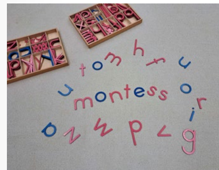
Sprachmaterial @ Kindergarten Hofsteigsaal

Die Sprache ist die Basis für jedes soziale Miteinander. In der Montessori Pädagogik spielt die Sprachförderung eine wichtige Rolle. Es gibt verschiedene Montessori Materialien mit dem Ziel der Wortschatzerweiterung, des Schreiben lernen und des Lesen lernen. Der mathematische Bereich umfasst Materialien, die das Kind vom ersten spielerischen Umgang mit Zahlen, bis hin zum selbständigen Rechnen in einfachster Form hinführen.