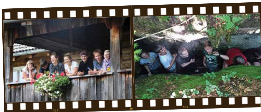
Spaß und Abwechslung vom tristen Coronaalltag standen auf dem Programm