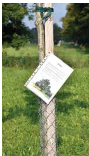
Jeder gepflanzte Baum wurde mit einer Infotafel beschriftet