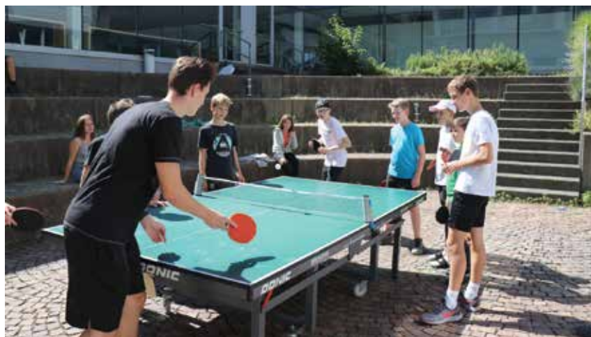
Spaß beim Tischtennispielen