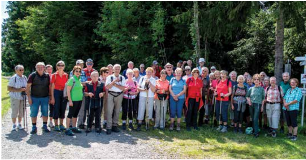
Wandergruppe bei Hochsträss

Auf über 1.000 m Höhe führt die grenznahe Wanderung entlang des Sulzberger Höhenrückens mit schönen Ausblicken auf die Bergwelt des Bregenzerwaldes, des Allgäus und der Schweiz. Hoher Ifen mit Gottesackerplateau und die Nagelfluhkette mit Rindalphorn, Hochgrat, Seelenkopf und Falken sind zum Greifen nah. Von Hochsträss, dem Wendepunkt der Tour, ging es über einen schattigen Wanderweg zurück. Nach wenigen Minuten Gehzeit lohnte sich der kurze Abstecher ins Wildrosenmoos, einem Landschaftskomplex aus Feuchtwiesen und Mooren. Ein schöner