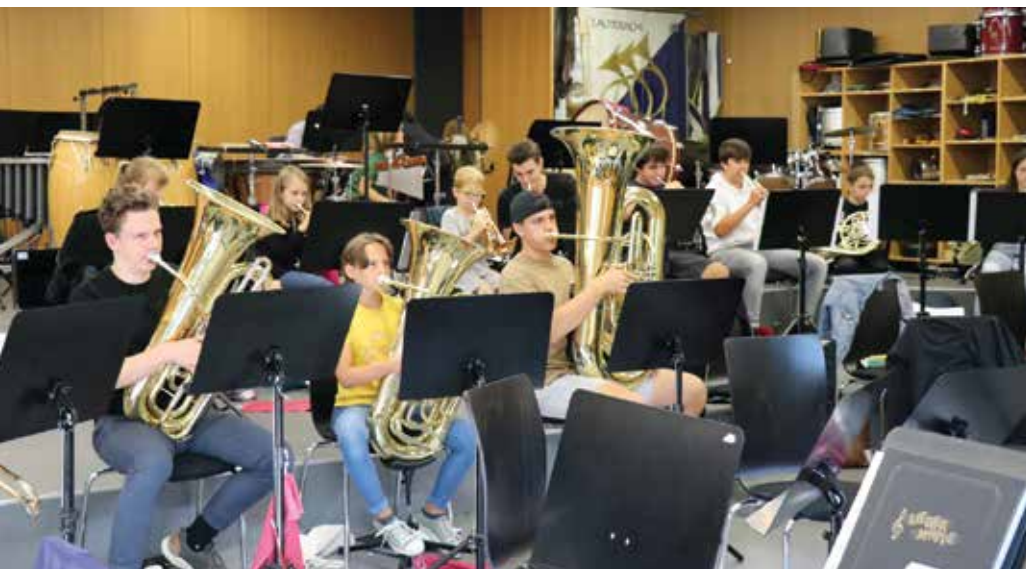
Probe der Jugendkapelle

Ohne Geald koa Musig! Wir bitten um Ihre Unterstützung zur Aufrechterhaltung unserer Kultur- und Jugendarbeit. Auch im zweiten Corona-Jahr muss unsere traditionelle Haussammlung ausfallen und wir bitten stattdessen wieder mit Abstand um Ihre finanzielle Unterstützung. Im Laufe des Oktobers werden Sie ein Informationsblatt zur Bürgermusik samt Zahlschein in Ihrem Briefkasten finden. Mit einer freiwilligen Spende können Sie uns dabei unterstützen, weiterhin intensive Jugendarbeit zu machen und tolle, anspruchsvolle Konzerte zu spielen. VIELEN DANK schon im Voraus – Ihre Bürgermusik.