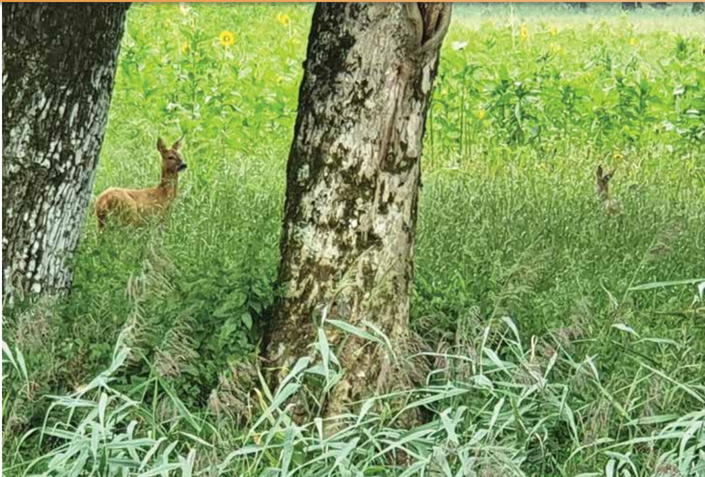
Führende Rehgeiß mit Kitze