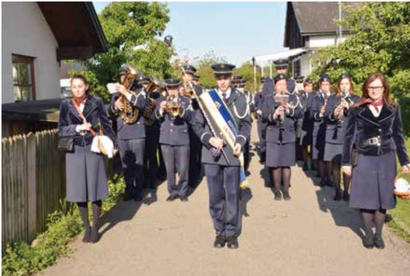
Tag der Blasmusik der Bürgermusik 2019

Aber zurück zu den Proben Tagen! Neben Stücken, wie dem „Saxophonflamingo“ oder dem „Fagottclown“ musste noch Platz für andere Lieder sein, denn die Jugendkapelle bereitete sich auch für das Moscht-Fäscht vor. Dort umrahmt die Jugendkapelle die heilige Festmesse am Sternenplatz. Natürlich kam auch das Freizeitprogramm nicht zu kurz und so spielten die Jugendlichen verschiedene Spiele und der Tischtennistisch wurde fleißig genutzt. Am Dienstag fand die JKL-Olympiade statt, bei der sich einzelne Gruppen verschiedenen Herausforderungen stellen mussten. Dabei wurde nicht nur die Sportlichkeit und Geschicklichkeit gefordert, sondern auch fürs Köpfchen war etwas dabei. In denselben Gruppen musste zu einem Lied ein Tanz überlegt werden, der so einfach gestaltet sein soll, dass – wie bei einem Flashmob – alle direkt mitmachen können.