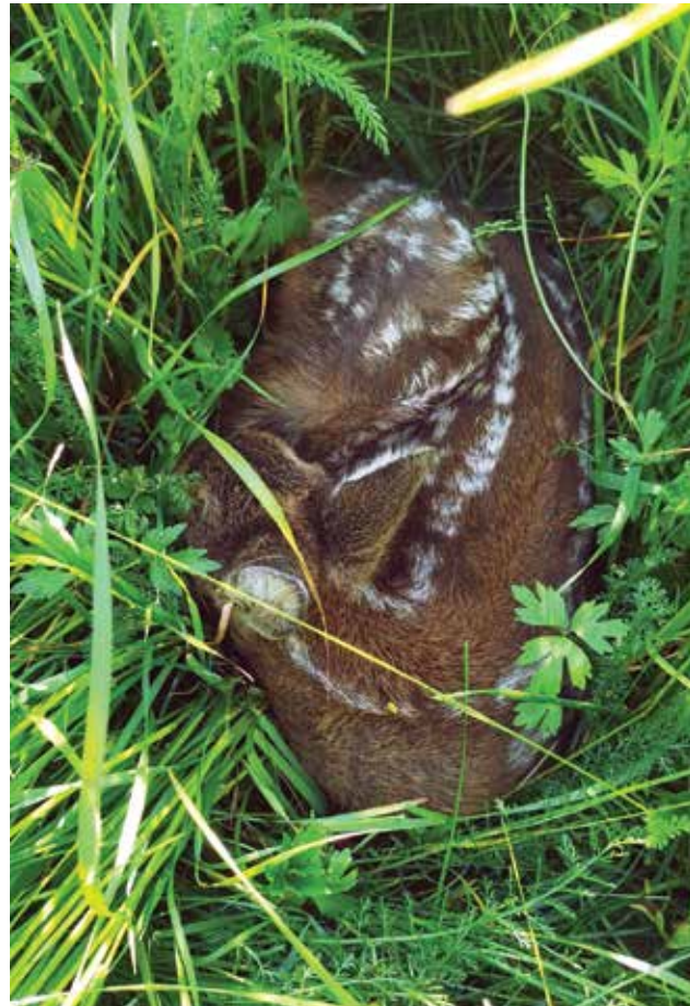
Abgelegtes Rehkitz im hohen Gras