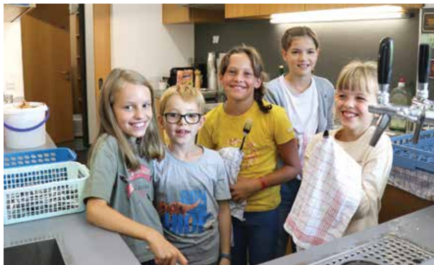
Fleißige Helfer beim Abwasch

Hinteregger für die gewissenhafte Vorbereitung und Durchführung der Probenwoche.