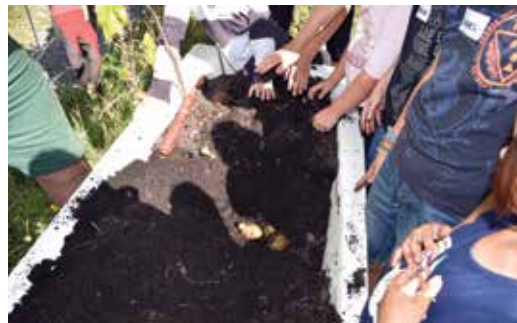
Zuerst mussten die Kartoffeln ausgegraben werden