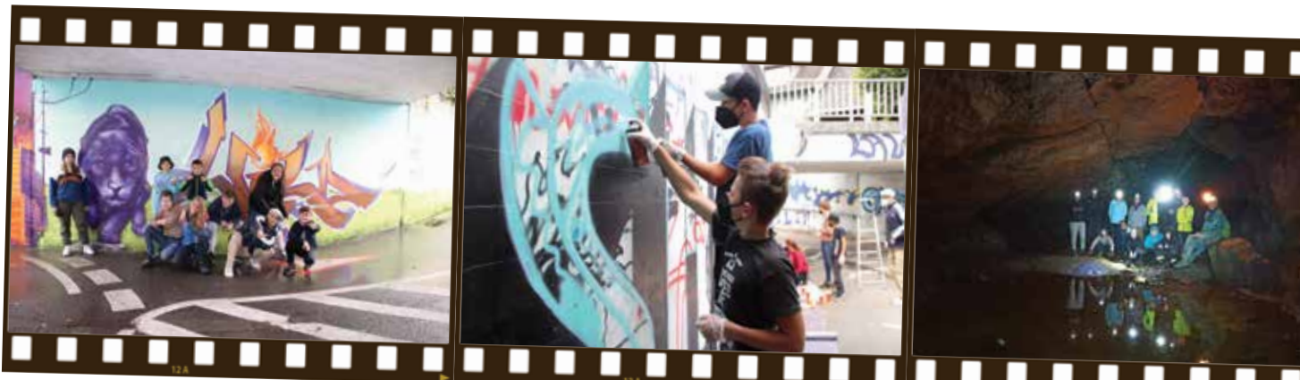
Die Jugendlichen waren mit viel Engagement bei der Sache