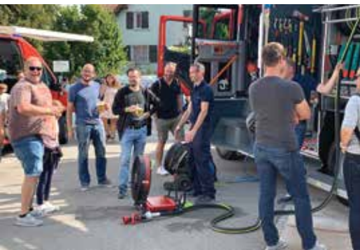
Interessierte Bevölkerung bei der Fahrzeug- und Geräteschau