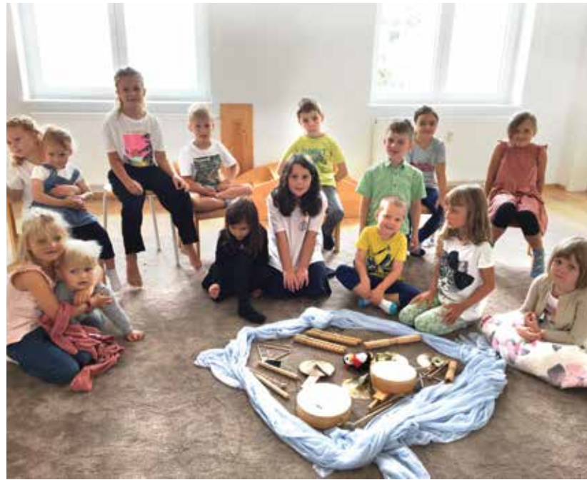
Im August trafen sich 13 singfreudige Kinder im Alter von 5–8 Jahren im Infantibus, um sich auf eine Reise ins Land der Singuine zu begeben

Wir hatten viel Spaß und konnten gar nicht auf unseren Stühlen sitzen bleiben – denn singen hält ja bekanntlich fit. Mit alten Singspielen verging die Zeit wie im Flug und schon bald standen die ersten Eltern da, denen wir gerne eine Kostprobe von unseren neuen Liedern preisgaben.