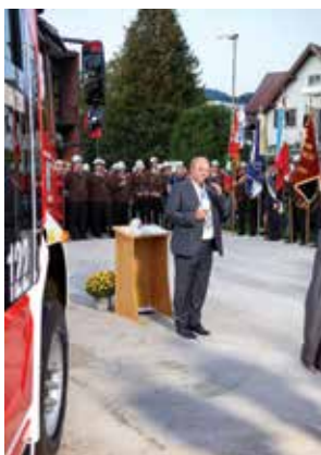
Grußworte von Bürgermeister Elmar Rhomberg