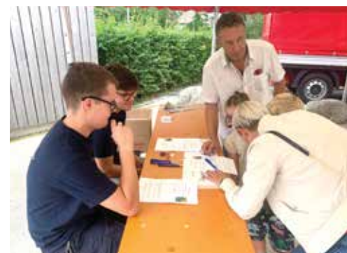
Feuerwehrquiz im Rahmen des Kinderprogramms