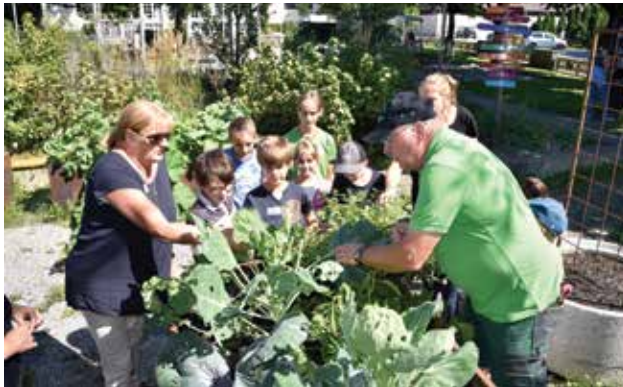
Bei der Kräutersammlung für das Kräutersalz