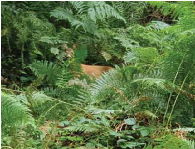
Waldreh in der Deckung