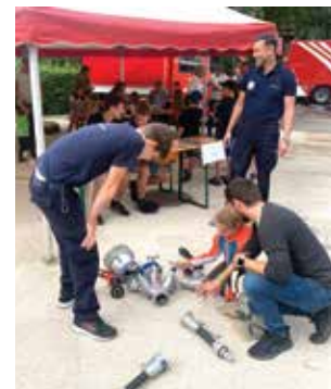
Kinderprogramm am Sonntag