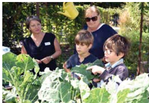
oben: Wie heißt das Gemüse? rechts: Nach getaner Arbeit ließen es sich die Kinder so richtig schmecken