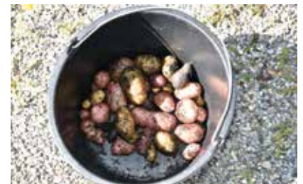
Kartoffeln in den verschiedensten Farben ernteten die Kinder