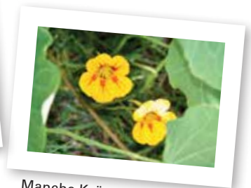
Manche Kräuter blühen gerade jetzt in den herrlichsten Farben