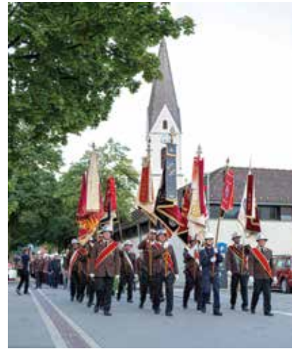
Fahnenblock beim Festzug zum Gerätehaus