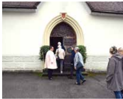
Besichtigung der Pfarrkirche in Au