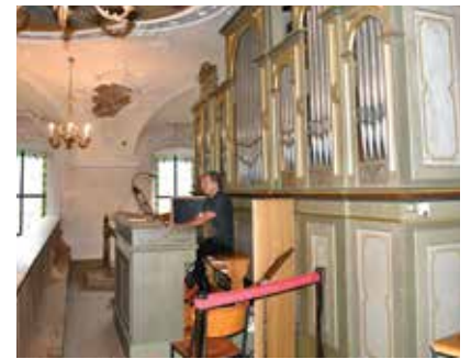
Der Organist begeisterte für die Gäste mit stimmungsvoller Orgelmusik