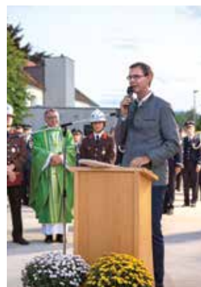
Grußworte Landeshauptmann Markus Wallner