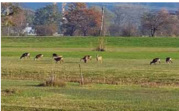
Rehsprung ohne Deckung im Ried