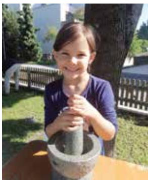
Bei der Herstellung des Kräutersalzes