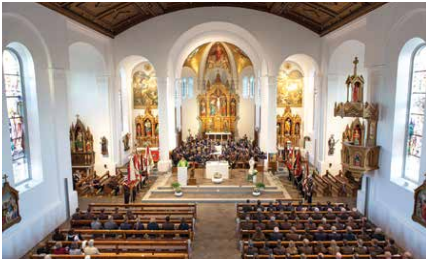
Festgottesdienst in der Pfarrkirche