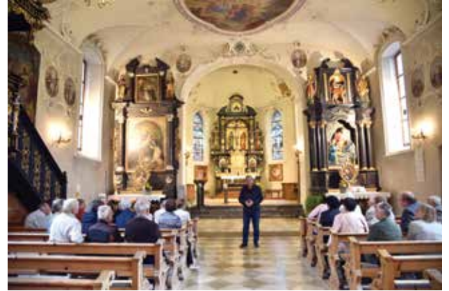
Walter Lingg führte die Seniorinnen und Senioren mit viel Wissen und Geschichte durch die Pfarrkirche