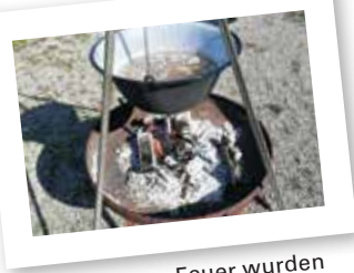
Auf offenem Feuer wurden die Kartoffeln gekocht

Alfred Stoppel erklärte den Kindern, welche Kräuter im Areal vom Essbaren Lauterach essbar sind und wie sie schmecken. Danach wurden die Kartoffeln geerntet, gewaschen und auf dem offenen Feuer gekocht. Inzwischen wurden die gesammelten Kräuter klein geschnitten, im Mörser mit dem Salz vermischt und in Gläser abgefüllt. Die gekochten Kartoffeln, mit dem frisch geernteten Gemüse und dem selbstgemachten Kräutersalz vermischt, schmeckte den Kindern einfach herrlich!