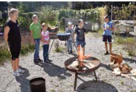
Für das Kochen der Kartoffeln wurde Feuer gemacht