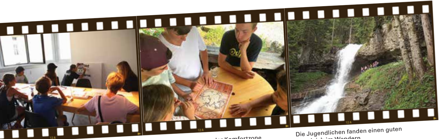
Beim Comicworkshop konnten sich die Jugendlichen kreativ austoben