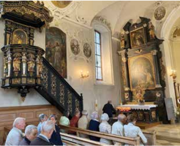
In der Pfarrkirche steht eine der ältesten Kanzeln, diese stammt aus dem 14. Jahrhundert, in Europa

Nach coronabedingter Pause durfte endlich wieder der Seniorenausflug, organisiert vom Frauenbund Guta und der Marktgemeinde Lauterach, stattfinden. So fanden sich zahlreiche Seniorinnen und Senioren ein, um im Bregenzerwald gemeinsam gemütliche Stunden zu verbringen. Bei Kuchen und Kaffee wurden die Gäste von der Obfrau des