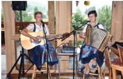
Die Bergziegen sorgten mit ihrer Musik und guten Witzen für tolle Stimmung

Mit Kässpätzle und Schnitzel ließ man den späten Nachmittag gemütlich ausklingen.