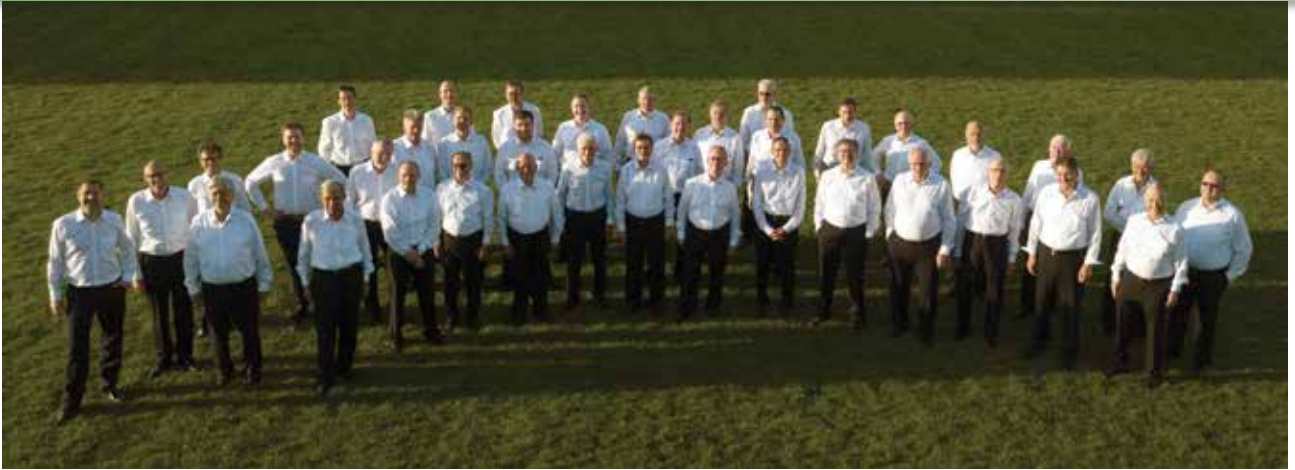
Die Mitglieder des Männerchors