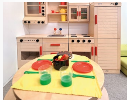
Lernen im Rollenspiel @ Kinderhaus am Entenbach

Jedes Kind soll seine eigenen Erfahrungen sammeln, kreativ sein und sich mit der Natur und seiner Umwelt verbunden fühlen. Somit wird das Kind für einen achtsamen Umgang mit seiner Lebenswelt sensibilisiert. Hauswirtschaftliche Tätigkeiten (Kuchen backen, etc.), Frische-Luft-Tage, Sammeln von Naturmaterialien, Spiele im Freien etc. sind dazu passende geleitete Aktivitäten, die wir täglich in unsere Arbeit miteinbinden.