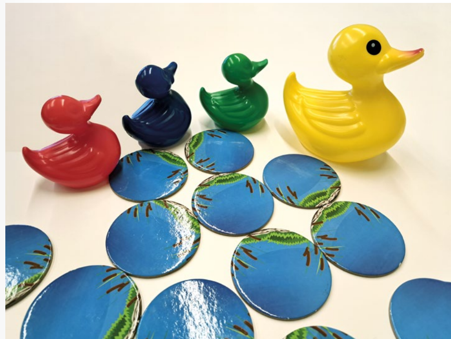
Wir begleiten das Kind und sehen beim Wachsen und Lernen zu. @ Kinderhaus am Entenbach

Im Zeitraum von Februar bis März treffen sich die Pädagogen und Pädagoginnen mit der Direktion der Volksschule. Bei diesem Treffen findet ein Austausch über die zukünftigen Schüler statt. Hierbei wird auch das Transitionsprotokoll der jeweiligen Kinder übergeben. Anfang März findet dann das Schulscreening in der Volksschule statt, zu dem die Eltern ihre Kinder begleiten. Gegen Ende des Schuljahres dürfen die zukünftigen Schüler:innen mit ihrem Pädagogen/ihrer Pädagogin an einem Vormittag die Schule besuchen und diese mit anderen zukünftigen Schülern entdecken. Dabei werden sie von ihren „Paten und Patinnen“, welche schon drei Jahre an der Schule sind, durch die Schule geführt. Diese „Paten und Patinnen“ haben die Aufgabe, die neuen Schüler:innen gerade am Schulanfang zu begleiten und zu unterstützen.