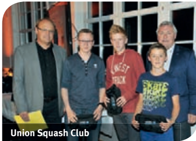
Union Squash Club