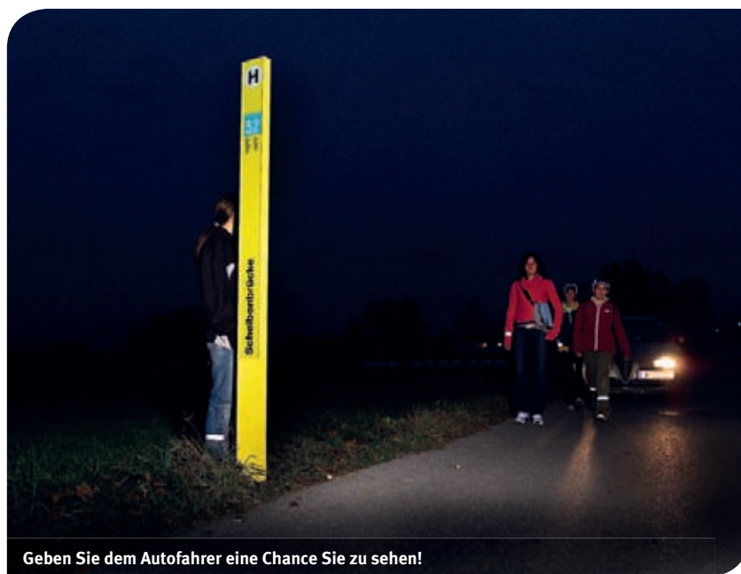
Geben Sie dem Autofahrer eine Chance Sie zu sehen!

Sehen und gesehen werden ist in der dunklen Herbst- und Winterzeit als Unfallprävention von großer Bedeutung. Die Verkehrsunfälle nehmen durch Dämmerung, Dunkelheit und künstliche Beleuchtung stark zu.