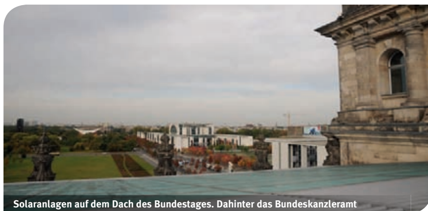
Solaranlagen auf dem Dach des Bundestages. Dahinter das Bundeskanzleramt

31 Mitglieder aus verschiedenen Vorarlberger e 5 -Teams besuchten Anfang Oktober die deutsche Bundeshauptstadt. Das ist die längste e 5 -Informations-Reise, die das Energieinstitut bisher organisiert hat.