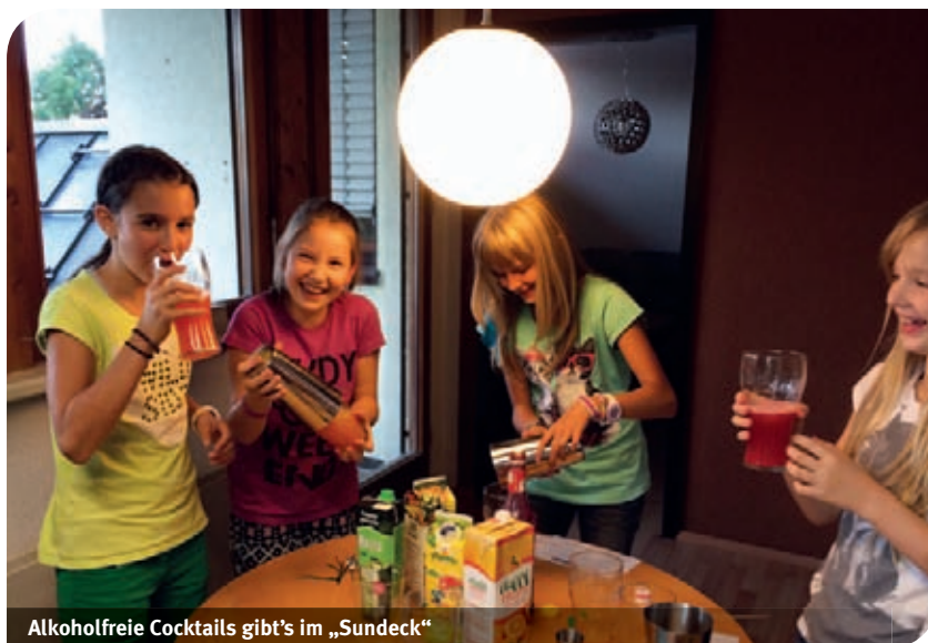
Alkoholfreie Cocktails gibt's im „Sundeck“

Seit vielen Jahren ist der Jugendtreff ein wichtiger Treffpunkt für Lauterachs Jugendliche.