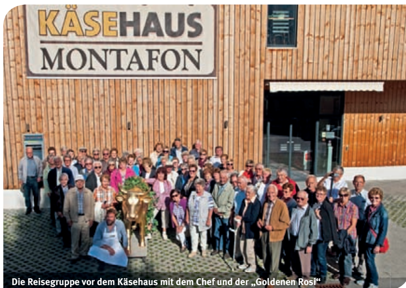
Die Reisegruppe vor dem Käsehaus mit dem Chef und der „Goldenen Rosi“

Interessant und abwechslungsreich erlebten 65 Teilnehmer die Fahrt in die Feriendörfer Schruns und Tschagguns. Das Käsehaus Montafon mit dem Hofladen, der Sennschule und Gastronomie unter einem Dach begeisterte die Besucher.