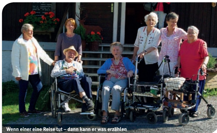
Wenn einer eine Reise tut – dann kann er was erzählen

Raus aus dem Alltag – rein in den Urlaub. Das ist für uns und auch für unsere Senioren im SeneCura Sozialzentrum eine lang erwartete Zeit im Jahr.