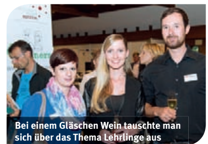
Bei einem Gläschen Wein tauschte man sich über das Thema Lehrlinge aus