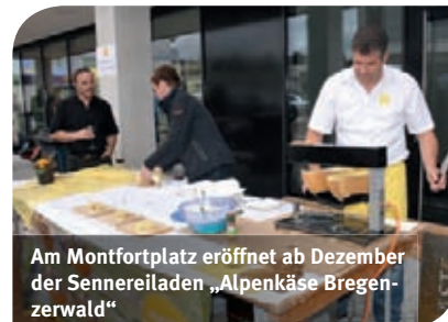
Am Montfortplatz eröffnet ab Dezember der Sennereiladen „Alpenkase Bregenzerwald“