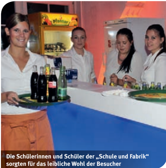
Die Schülerinnen und Schüler der „Schule und Fabrik“ sorgten für das leibliche Wohl der Besucher

In der „Alten Säge“ fand heuer zum ersten Mal die Sportlerehrung als eigenständige Veranstaltung – getrennt vom Neujahrsempfang – statt.