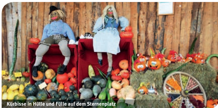
Kürbisse in Hülle und Fülle auf dem Sternenplatz

Das Kürbisfest am Sternenplatz fand bei herrlichem Herbstwetter statt. Viele Besucher beteiligten sich beim Kürbisspiel und Kürbisschnitzen.