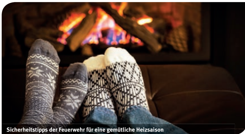
Sicherheitstipps der Feuerwehr für eine gemütliche Heizsaison

Mit der kalten Jahreszeit startet auch wiederum die Heizsaison. Hier einige Tipps und Anregungen, die zu beachten sind, damit gemütliche Wärme nicht mit dem „Besuch“ der Feuerwehr und einem Inferno endet.