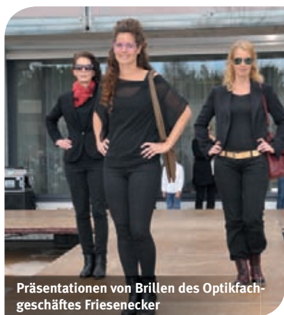
Präsentationen von Brillen des Optikfachgeschäftes Friesenecker