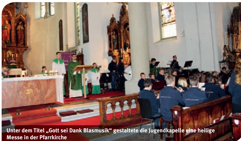
Unter dem Titel „Gott sei Dank Blasmusik“ gestaltete die Jugendkapelle eine heilige Messe in der Pfarrkirche

Anlässlich des 90-Jahr-Jubiläums des Vorarlberger Blasmusikverbandes gestaltete die Jugendkapelle Lauterach unter dem Titel „Gott sei Dank Blasmusik“ Mitte Oktober die heilige Messe in der Pfarrkirche.