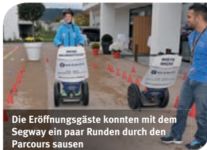
Die Eröffnungsgäste konnten mit dem Segway ein paar Runden durch den Parcours sausen