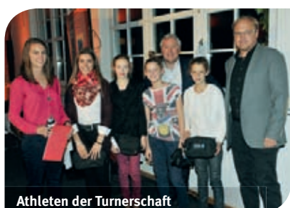
Athleten der Turnerschaft