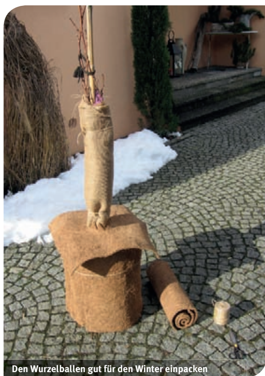
Den Wurzelballen gut für den Winter einpacken

Pflanzen, die einen Winterschutz brauchen, so spät als möglich ins Winterquartier einlagern und so früh als möglich im Frühjahr wieder herausholen. Die meisten Pflanzen halten Temperaturen knapp über Null Grad Celsius problemlos aus vor allem, wenn wir sie ganz an die Hauswand rücken.