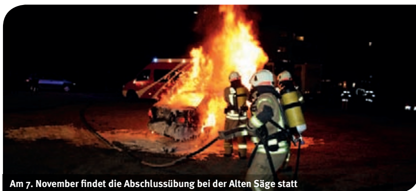
Am 7. November findet die Abschlussübung bei der Alten Säge statt

Im Rahmen einer großen öffentlichen Übung präsentieren die Feuerwehrjugend und die Aktiven der Ortsfeuerwehr der Bevölkerung auch in diesem Jahr wiederum ihr Können und ihre Einsatzstärke für den Ernstfall.