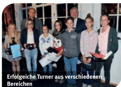
Erfolgreiche Turner aus verschiedenen Bereichen