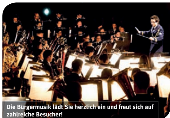
Die Bürgermusik lädt Sie herzlich ein und freut sich auf zahlreiche Besucher!

Beim Cäcilienkonzert stellte sich unser Dirigent die Frage, warum nicht Musik in den Mittelpunkt zu stellen, die Ihnen und uns GESTERN schon einmal ausgesprochen gut gefallen hat, die HEUTE immer noch gefragt ist und die mit Sicherheit MORGEN nach wie vor gerne gehört wird.