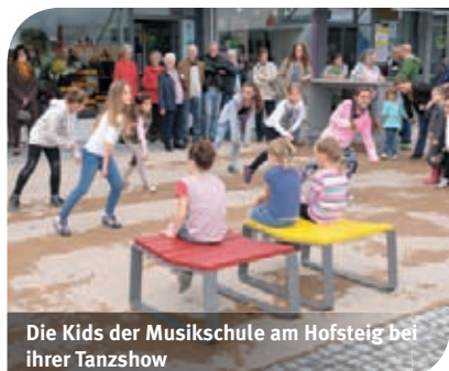
Die Kids der Musikschule am Hofsteig bei ihrer Tanzshow