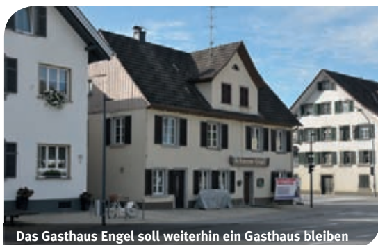
Das Gasthaus Engel soll weiterhin ein Gasthaus bleiben

Wie das Foto zeigt, steht das langjährige Gasthaus Engel zum Verkauf. Die bisherige Eigentümerfamilie Schwarz ist vor wenigen Wochen in eine neue Wohnung in Lauterach umgezogen. Der Marktgemeinde Lauterach ist es jedoch ein großes Anliegen, dass nach dem Verkauf der Gastbetrieb wieder aufgenommen wird und hoffentlich auch lange erhalten bleibt. „Es ist keine Kernaufgabe einer Gemeinde, Gasthäuser