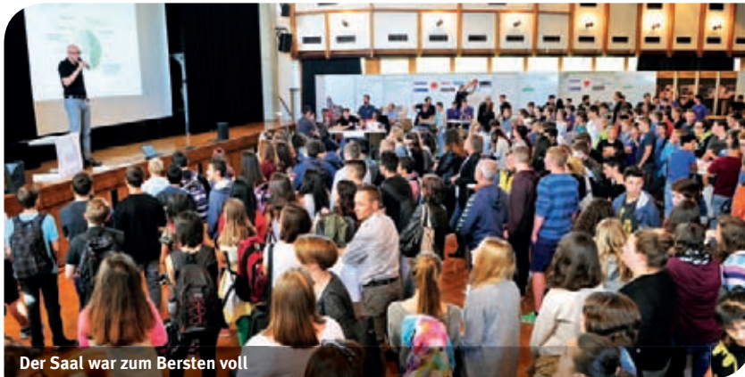
Der Saal war zum Bersten voll