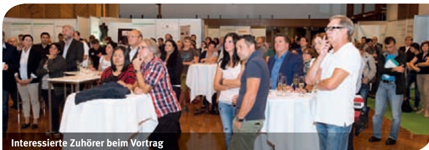
Interessierte Zuhörer beim Vortrag