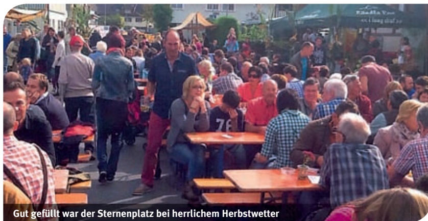
Gut gefüllt war der Sternenplatz bei herrlichem Herbstwetter