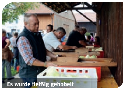
Es wurde fleißig gehobelt