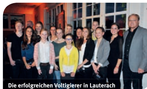
Die erfolgreichen Voltigierer in Lauterach