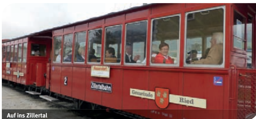
Auf ins Zillertal

Mit der Fahrt im „Dampfzüge“ von Jenbach aus begann unser Ausflug in das schöne Zillertal. Gemütlich „zogelten“ wir in den alten Waggons mit Holzbestuhlung nach Mayrhofen. Auf der Fahrt konnten wir uns überzeugen, welche rege Bautätigkeit in allen Orten stattfindet. Nach der Mittagspause führte unsere Weiterfahrt nach Rattenberg. In der kleinsten Stadt Österreichs besuchten unsere weiblichen Teilnehmer die vielen Glasgeschäfte. Die Männer genossen derweil einen guten Kaffee oder ein Bierchen. Auf der Heimfahrt machten wir noch einen Abstecher nach Koblach. In der dortigen „Harmonie“ wurde den Teilnehmern ein üppiger, vom Verein bezahlter Jausenteller serviert.