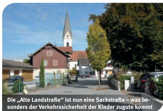
Die „Alte Landstraße“ ist nun eine Sackstraße – was besonders der Verkehrssicherheit der Kinder zugute kommt

Im räumlichen Entwicklungskonzept erörterte man u.a. das Thema „schwächere Verkehrsteilnehmer“ besonders im Bereich der Zentrumsgestaltung.