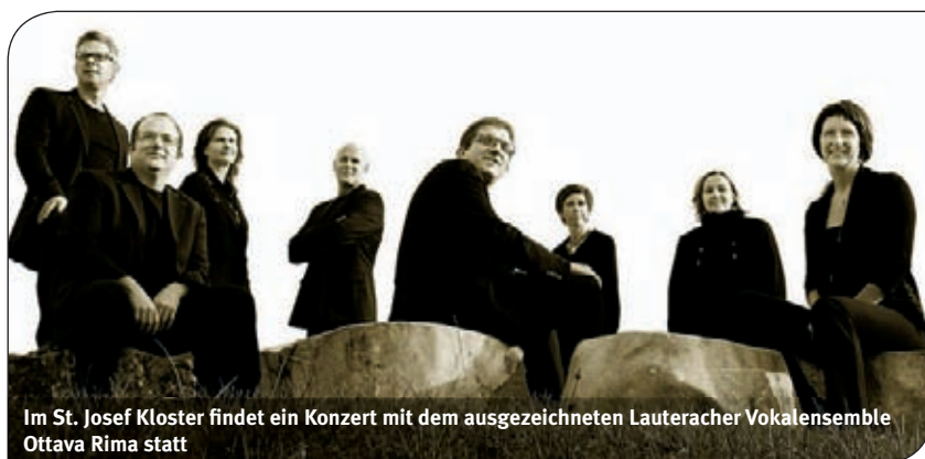
Im St. Josef Kloster findet ein Konzert mit dem ausgezeichneten Lauteracher Vokalensemble Ottava Rima statt