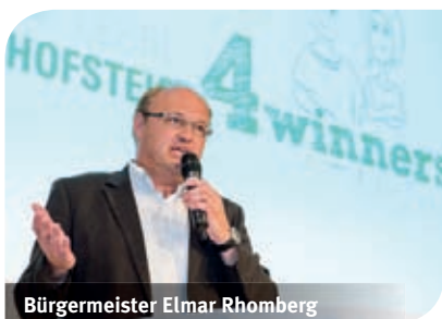
Bürgermeister Elmar Rhomberg