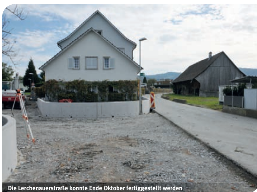
Die Lerchenauerstraße konnte Ende Oktober fertiggestellt werden

Vier Bauabschnitte wurden in den letzten Jahren an der Lerchenauerstraße fertiggestellt. Die Marktgemeinde Lauterach möchte sich an dieser Stelle bei allen Anrainern, sowie Straßen- und Radwegbenützern für das Verständnis der baubedingten Behinderungen bedanken.