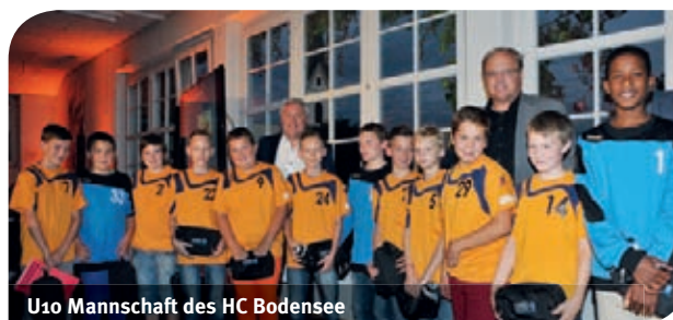
U10 Mannschaft des HC Bodensee