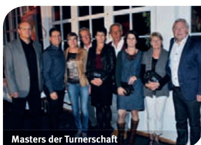
Masters der Turnerschaft