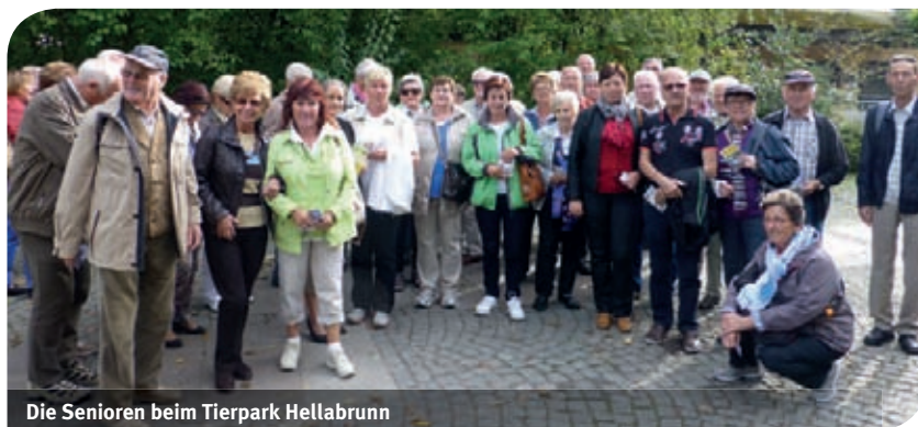
Die Senioren beim Tierpark Hellabrunn