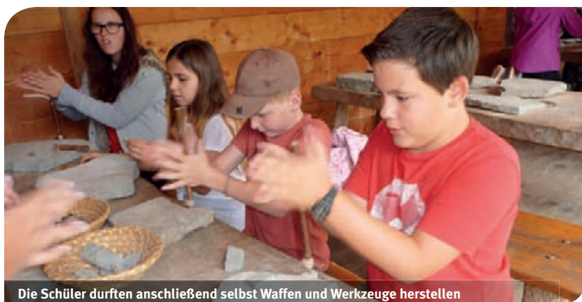
Die Schüler durften anschließend selbst Waffen und Werkzeuge herstellen

Das heurige Schuljahr begann für die Zweitklässler der Mittelschule mit einem Ausflug in die Vergangenheit. Die Fahrt zu den Pfahlbauten in Unteruhldingen entführte die Schüler in eine längst zurückliegende Zeit, die aber immer wieder faszinierend ist. Wie lebten die Menschen damals? Was kannten sie schon, wie stellten sie ihre Werkzeuge und Waffen her? Wissen wir das alles genau oder könnte es auch anders gewesen sein? Diesen und noch mehr Fragen stellten sich unsere kleinen Archäologen und durften im Anschluss noch selbst Waffen und Werkzeuge herstellen. Die Exkursion machte neugierig auf den heuer beginnenden Geschichtsunterricht.