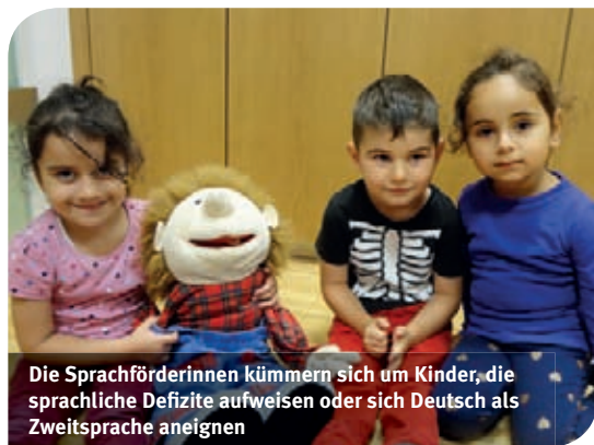
Die Sprachförderinnen kümmern sich um Kinder, die sprachliche Defizite aufweisen oder sich Deutsch als Zweitsprache aneignen

Eine Sprache zu lernen ist für die Zukunft der Kinder enorm wichtig und stellt eine große Herausforderung dar. Sprache eröffnet die Möglichkeit sich auszudrücken, Wünsche zu äußern, Fragen zu stellen, Antworten zu geben und Zusammenhänge zu verstehen.