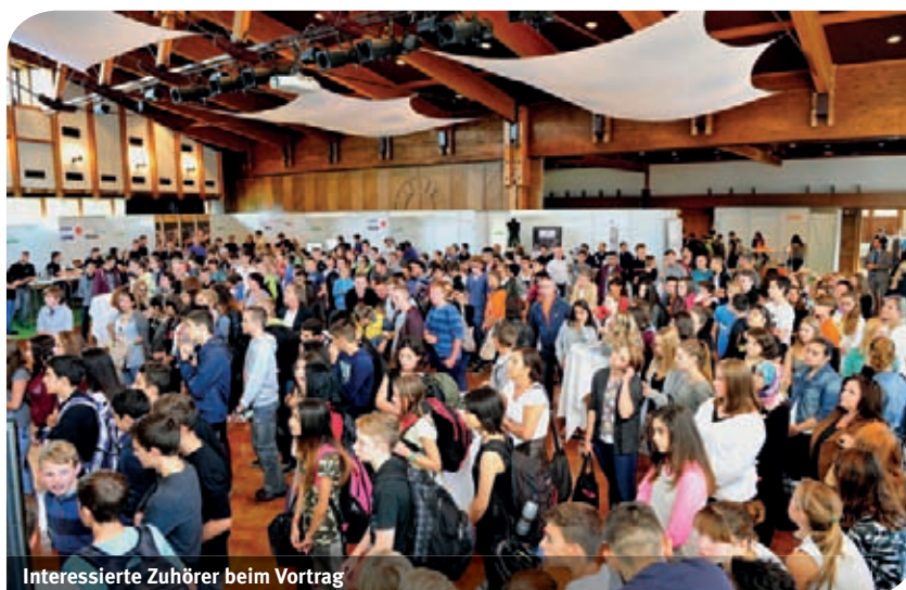
Interessierte Zuhörer beim Vortrag