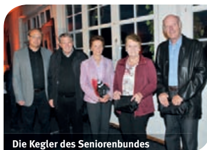
Die Kegler des Seniorenbundes