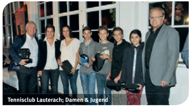
Tennisclub Lauterach; Damen & Jugend