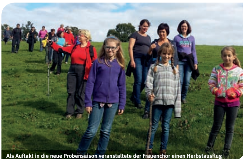
Als Auftakt in die neue Probensaison veranstaltete der Frauenchor einen Herbstausflug

Mit Bahn und Bus fuhren die Damen aufs Bödele. Ein kurzer Fußmarsch führte zur Hütte des Lauteracher Schivereins, wo das Basislager aufgeschlagen wurde und eine kulinarische Stärkung wartete.