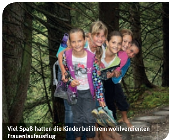
Viel Spaß hatten die Kinder bei ihrem wohlverdienten Frauenlaufausflug

Als größte teilnehmende Gemeinde haben wir Lauteracherinnen auch heuer wieder gewonnen und die uns zur Verfügung gestellten Gutscheine für die Bergbahnen Brandnertal gerne entgegengenommen.