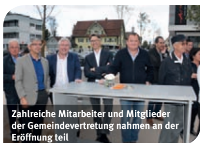
Zahlreiche Mitarbeiter und Mitglieder der Gemeindevertretung nahmen an der Eröffnung teil