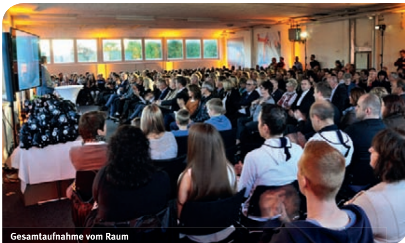
Gesamtaufnahme vom Raum