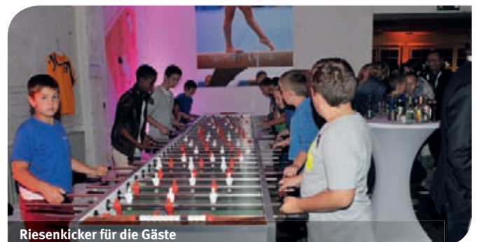
Riesenkicker für die Gäste