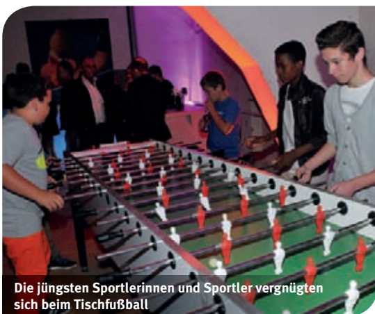
Die jüngsten Sportlerinnen und Sportler vergnügten sich beim Tischfußball