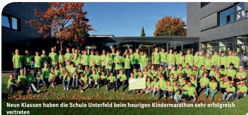
Neun Klassen haben die Schule Unterfeld beim heurigen Kindermarathon sehr erfolgreich vertreten

Unter den anfeuernden Rufen vieler Eltern, Geschwister und Lehrer gaben die Schüler ihr Bestes. Der 1b Klasse gratulieren wir zum hervorragenden 1. Platz und freuen uns auf den Kindermarathon 2015.