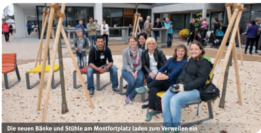
Die neuen Bänke und Stühle am Montfortplatz laden zum Verweilen ein