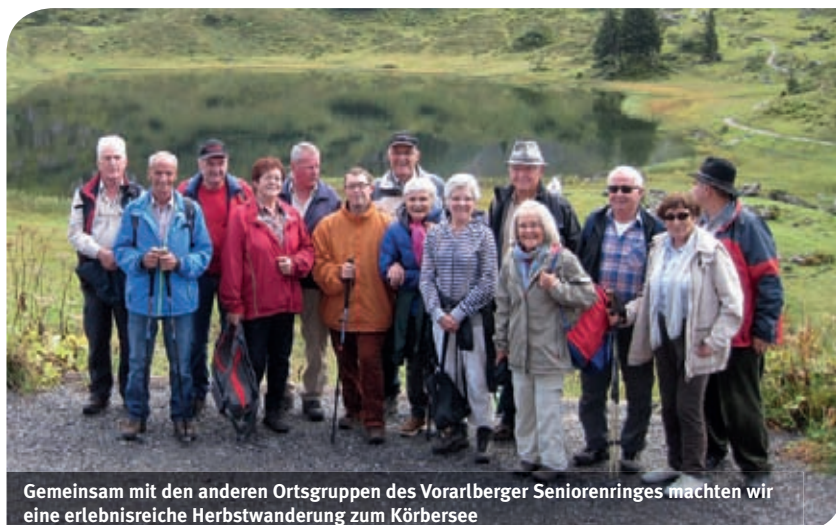
Gemeinsam mit den anderen Ortsgruppen des Vorarlberger Seniorenringes machten wir eine erlebnisreiche Herbstwanderung zum Körbersee

Trotz Starkregen, Sturmböen und Graupelschauern wanderten die Senioren unbeirrt ihrem Ziel entgegen. Dort angekommen, stärkte man sich im "Berghotel Körbersee". Danach ging die Wanderung bei Sonnenschein zurück zum Kälbelesee, von wo aus der Bus die Teilnehmer dieser vom Vorarlberger Seniorenring bestens organisierten Herbstwanderung zurück ins Rheintal brachte. An dieser Stelle danken wir der Landesorganisation des Vorarlberger Seniorenringes für die tolle Organisation und den finanziellen Beitrag.