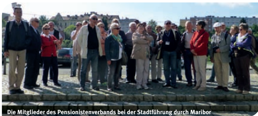
Die Mitglieder des Pensionistenverbands bei der Stadtführung durch Maribor

Unser erstes Ziel war die Südoststeiermark (Vulkanland), wo wir in Oberpurkla Quartier bezogen. Den zweiten Tag verbrachten wir in Maribor (Marburg), der zweitgrößten Stadt Sloweniens, mit interessanter Stadtführung und einem Einkaufsbummel.