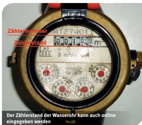
Der Zählerstand der Wasseruhr kann auch online eingegeben werden