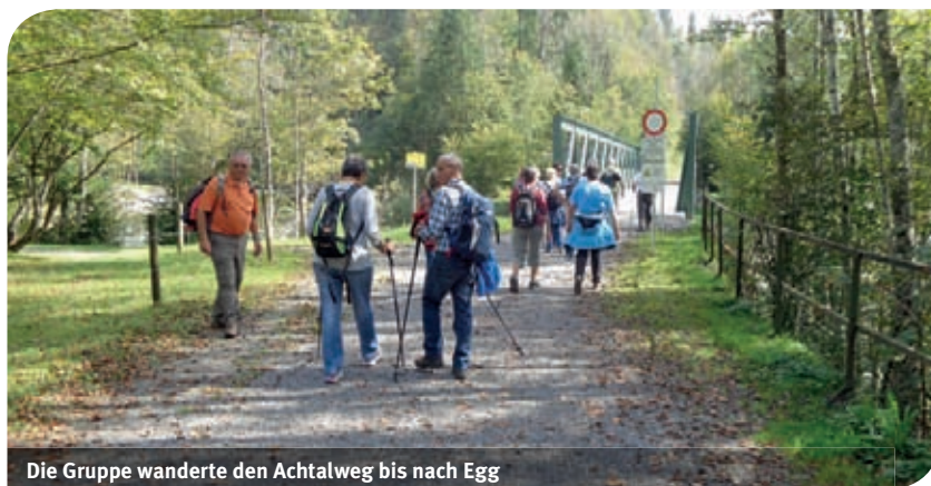
Die Gruppe wanderte den Achtalweg bis nach Egg