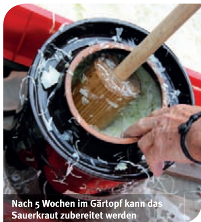
Nach 5 Wochen im Gärtopf kann das Sauerkraut zubereitet werden